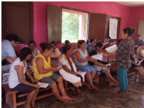
REUNION CON EL GRUPO DE DES. COM. SUPERVISION DEL TERRENO PARA EL PROYECTO DEL HUERTO FAMILIAR