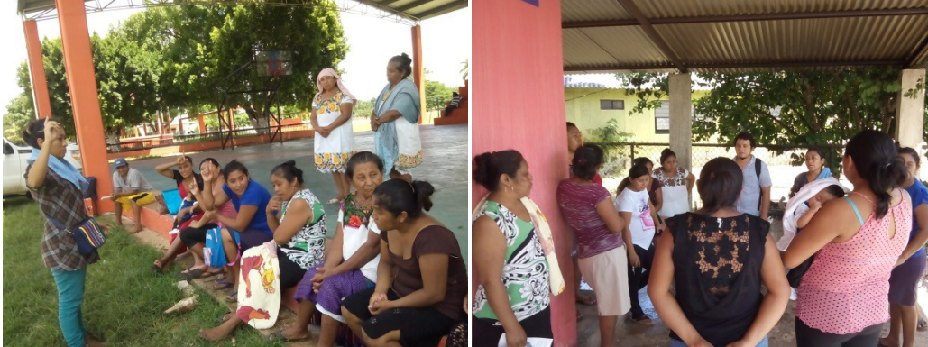
REUNION CON EL GRUPO DE DES. COM. Y ESPACIOS DE ALIMENTACION PARA EL PROYECTO DE HUERTO FAMILIAR