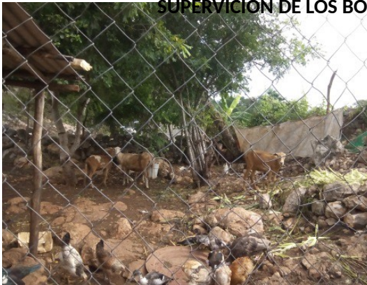
SUPERVISION DE LOS BORREGOS DEL PROYECTO EL TAJONAL