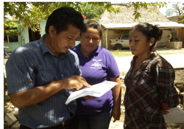
SUPERVISION DEL TERRENO PARA EL PROYECTO DE HUERTO FAMILIAR Y REUNION PARA EL PROYECTO DE CUIDADO DEL ADULTO MAYOR