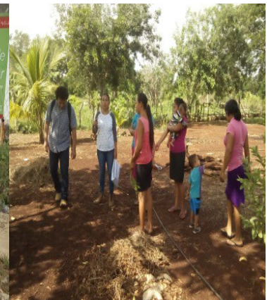
REUNION CON EL GRUPO DES. COM.